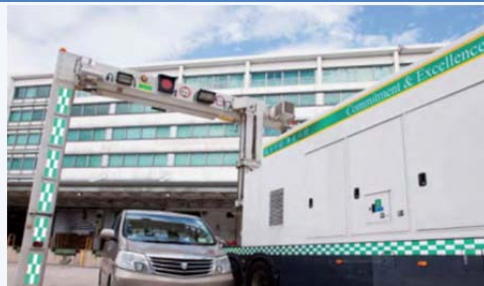
▲ 為香港海關的流動 X 光車輛提供維修保養服務，確保有關車輛能無間斷地偵測走私貨品。

港珠澳大橋是連接內地的陸路運輸新通道，而大橋及人工島亦快將落成。路政署亦委託機電署，為港珠澳大橋香港口岸過境設施提供技術支援服務。香港第一台門架式固定 X 光車輛檢查系統，將會在香港口岸過境設施區安裝使用，而其他邊境口岸預期會陸續加設類似的設施。