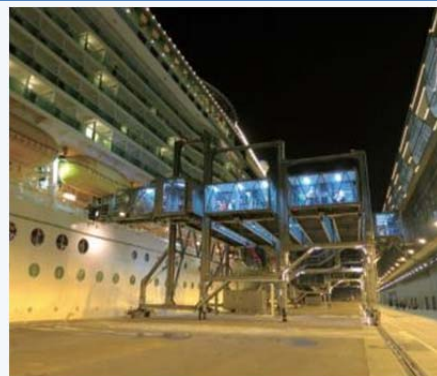
▲ 啟德郵輪碼頭乘客登船橋。

除了旅客服務外，海上物流交通亦十分頻繁。因此，機電署亦為海事處用以在本港水域提供船隻航行資訊、統籌及導航協助的船隻航行監察系統，提供顧問和項目管理服務。