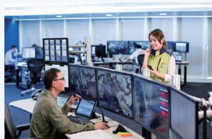
▲ 協助海事處提升船隻航行監察服務系統和提供維修保養服務，確保船隻航行及監察工作的效率。