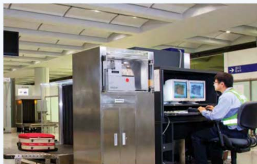
▲ 機電署負責香港海關位於機場的機電設備維修保養工作。