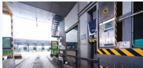
▲ 落馬洲管制站的車輛自動清關支援系統，由機電署維修保養，確保清關過程順暢快捷。